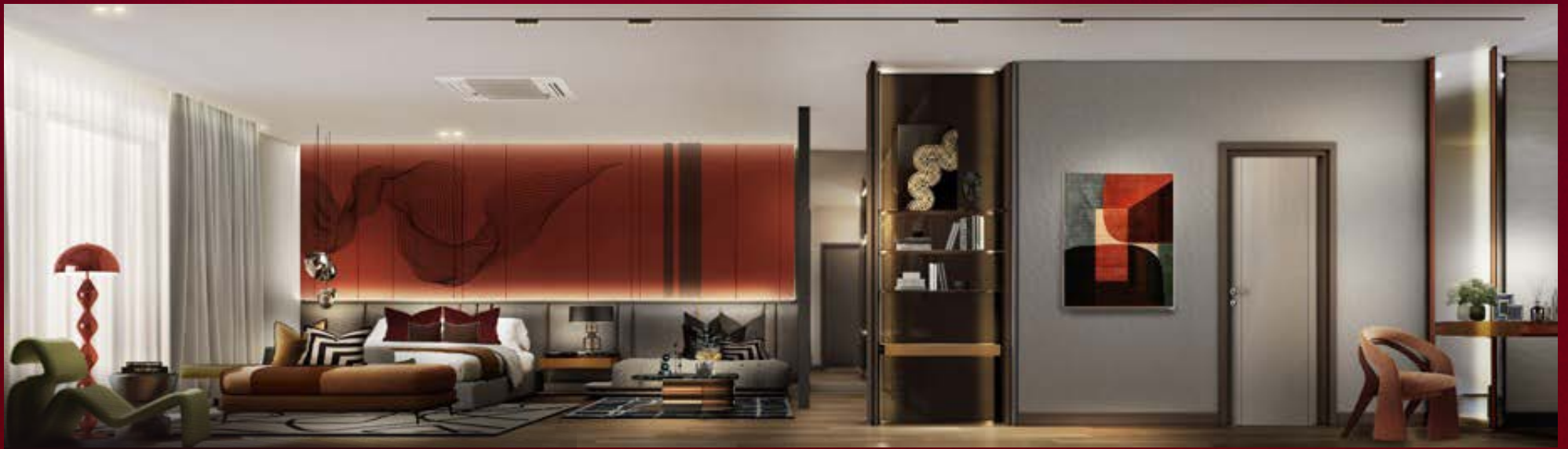
MASTER PENTHOUSE BEDROOM ▲ 55.90 SQ.M