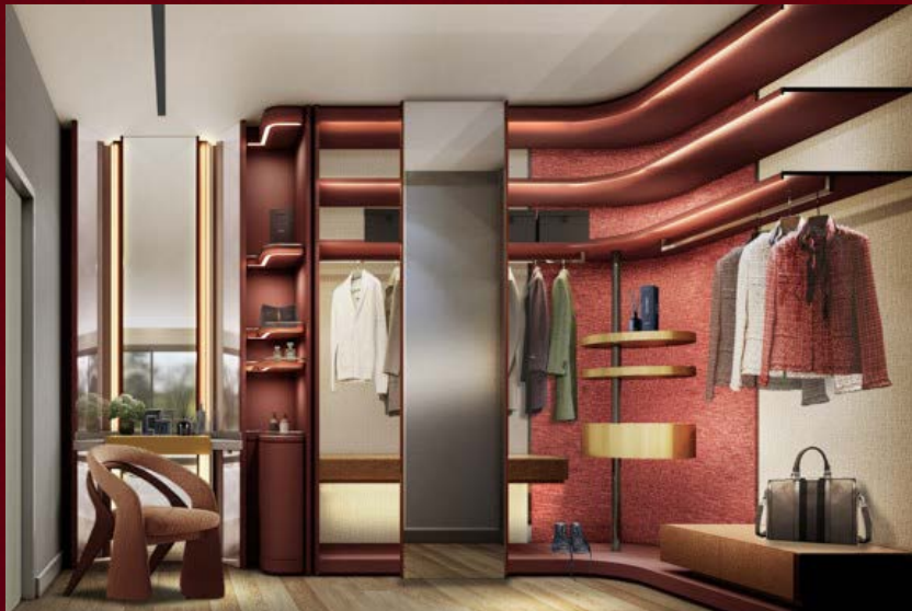
▲ WALK IN CLOSET